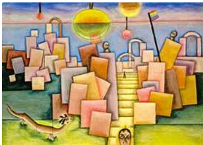
Rocas Lagui 1933 Acuarela 40 x 55,5 cm

Te invito a entrar al universo de Xul Solar.